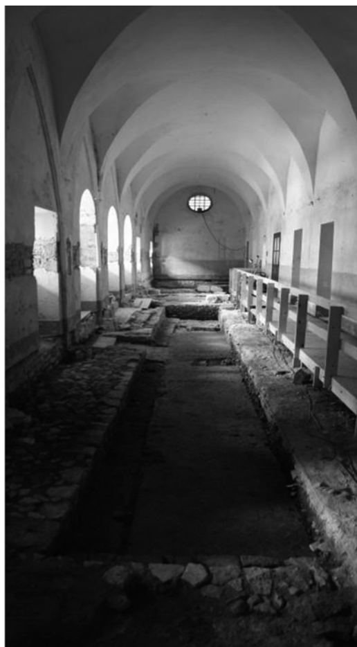
Plan de Cluny et vue de la « galerie rouge » en cours de fouille.